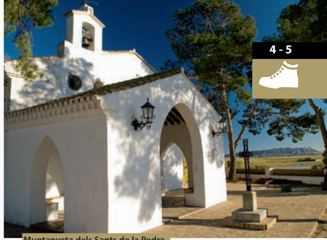
Muntanyeta dels Sants de la Pedra 39° 14' 31.80" N 0° 18' 58.20" W