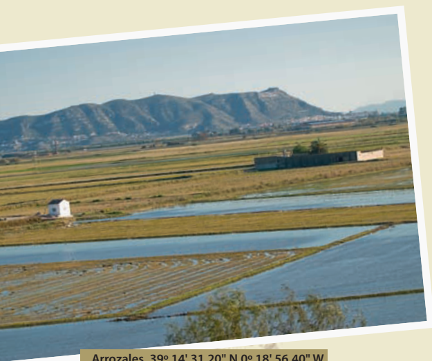
Arrozales 39° 14' 31.20" N 0° 18' 56.40" W