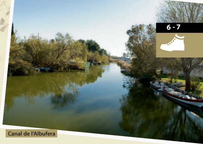
Canal de l'Albufera

cinco metros de altura. Estas cercas tradicionales sirven de límite a diferentes propiedades. Como la propiedad de la tierra está aquí muy fragmentada, el conjunto es un mar de cercas de cañizo que dan al entorno un gran valor paisajístico y cultural, digno de ser protegido, y resguardan a los árboles frutales y las hortalizas del viento y del salitre que éste transporta. Llegamos a la playa del Dosser de Cullera, y en ella podemos encontrar los cordones dunares que mejor grado de conservación tienen de toda la franja litoral de l'Albufera. La playa del Dosser es una de las menos masificadas de la zona e, incluso en verano, se puede respirar la tranquilidad del Mediterráneo. Sin salir de la población de El Faro de Cullera, donde está ubicada la playa del Dosser, en la plaza Doctor Fleming s/n podremos visitar la cueva-museo del Dragut. El 25 de mayo de 1550, como parte de su campaña de saqueo por el Mediterráneo, el corsario berberisco Dragut, lugarteniente de Barbarroja, consiguió un importante botín en bienes y cautivos. El suceso causó gran conmoción en la Cullera de la época y la villa quedó prácticamente despoblada durante décadas. En la cueva en la que, según la leyenda se produjo el intercambio de prisioneros, se ubica el museo sobre la piratería mediterránea en el siglo XVI. Visitamos el museo y nos quedamos a los pies de la Sierra de les Raboses. El nombre de la montaña se debe a que en una época habitaban