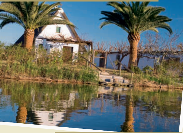
Barraca valenciana 39° 18' 54.00" N 0° 19' 6.00" W

gran valor etnológico. Todos los objetos expuestos pertenecen al cultivo tradicional del arroz. Datan de los siglos XIX y XX. En el museo se explica cómo ha evolucionado todo el proceso de labranza hasta la siembra. Otra de las salas se encuentra dedicada a la gastronomía del arroz y en ella podemos encontrar utensilios de cocina. El cultivo del arroz, además de ser una actividad agraria de enorme importancia en la zona y, por extensión, en la provincia de Valencia, constituye un sistema fundamental para la conservación de la riqueza biológica del parque, puesto que sustenta una vegetación y fauna invertebrada asociada, que constituye la base trófica de numerosas especies de vertebrados, principalmente aves. El arrozal constituye un ambiente complementario al del lago como área de alimentación y paso vital durante el período invernal y los pasos migratorios. Nos dirigimos a Sueca por las partidas del Clot de Minyana y del Castillo. Cuando alcancemos el discurrir de la carretera CV-500, un trayecto de ida y vuelta de unos tres kilómetros nos llevará hasta la Muntanyeta dels Sants de la Pedra, la cual no hay que confundir con la ermita que lleva el mismo nombre, en la que está situada el Museo del Arroz del que acabamos de hablar. La Muntanyeta dels Sants de la Pedra de Sueca es como una isla en medio de los arrozales, especialmente cuando se