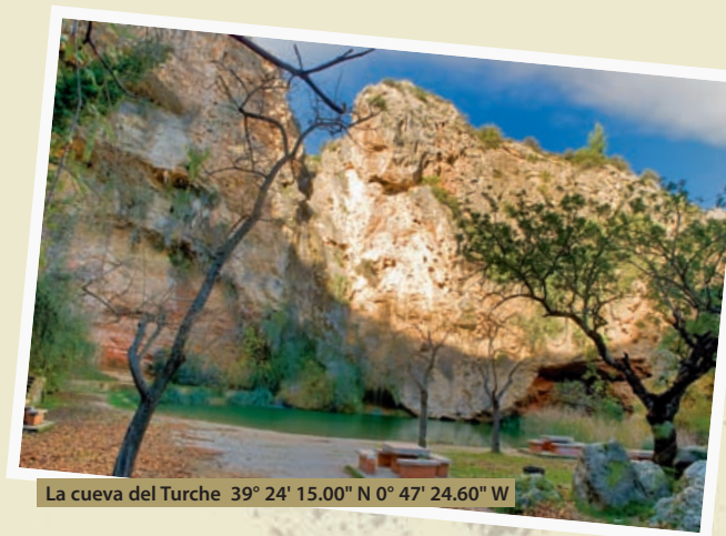
La cueva del Turche 39° 24' 15.00" N 0° 47' 24.60" W

Salimos de Dos Aguas en dirección a Millares por la carretera CV-580. Por el camino descendente observamos cómo la vegetación se hace más abundante a medida que nos acercamos al río Júcar. A mitad camino de Dos Aguas a Millares nos topamos con el puente del Júcar. El puente posee un arco sobre el que descienden a ambos lados cables que conforman un elemento arquitectónico sorprendente debido a su emplazamiento, en medio de la naturaleza más salvaje, entre montañas de amenazadores riscos. Después de cruzar el río Júcar una dura subida nos llevará hasta Millares. Un kilómetro antes de alcanzar la villa parte desde nuestra derecha una vieja carretera que llevaba a Cortes de Pallás en un trayecto espectacular por el interior de la hoz del Júcar. Hoy esta carretera nos permite llegar tan sólo hasta el caserío de Otonel, pero su vertiginoso periplo de continuadas curvas sobre peñascos casi aéreos se ha visto cortado por el nuevo embalse del Naranjero, restándole éste parte de la magia a uno de los desfiladeros más espectaculares y de mayor longitud de las montañas interiores valencianas. La hoz del Júcar es aquí un estrecho paso pétreo de verticalidades imposibles; un lugar que emociona por su silencio y en el que gozan de libertad miles de cabras salvajes, jinetas, jabalíes o muflones. Esta zona del Macizo del Caroig es Reserva de Caza y existen