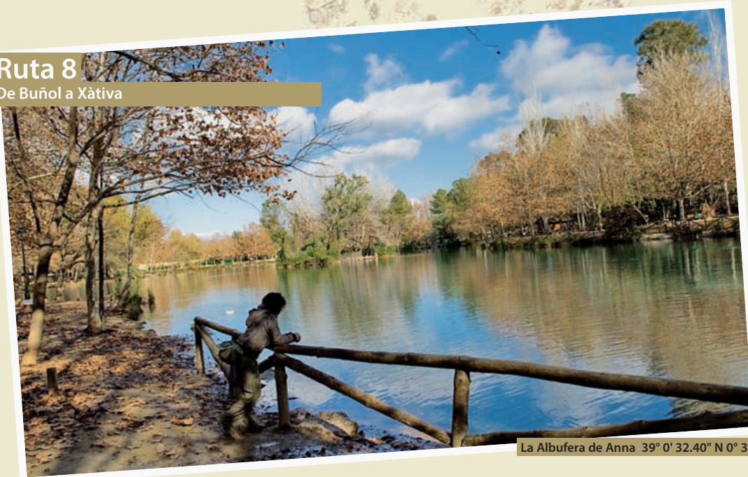
La Albufera de Anna 39° 0' 32.40" N 0° 39' 30.60" W

la Orden que lo habitaba a trasladarse al Palacio del Temple de Valencia. Tras la desamortización de Mendizábal, pasó a ser propiedad particular hasta que el Ayuntamiento lo recuperó en 1978. Tras haber admirado el castillo de Montesa nuestra ruta sigue hasta Canals. Volveremos por la A-35 hasta un desvío por la CV-598 que nos llevará directamente a Canals. En este lugar, situado en el valle de Montesa, vino al mundo Alfons Borja, que luego se convertiría en el Papa Calixto III. Por ello el monumento más importante de la localidad está relacionado con esta importante familia. El torreón de los Borja fue una antigua torre de vigilancia musulmana que se edificó probablemente en el siglo XII. Posteriormente se integró en el palacio de los Borja del que es el principal resto en la actualidad. Fue restaurado en los años 90 del siglo XX. Visitamos el curso del río de les Santes, que llena Canals de lavaderos públicos, así como el platanero conocido como la Lloca: se trata de un árbol monumental de dimensiones ciclópeas. Abandonamos Canals y nos dirigimos al final de nuestra ruta: Xàtiva. La capital de La Costera fue una de las poblaciones más importantes del Reino de Valencia, rivalizando incluso con Valencia y Orihuela, las otras dos ciudades más importantes