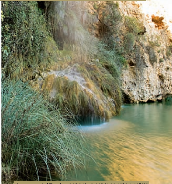
La cueva del Turche 39° 24' 15.00" N 0° 47' 24.60" W

La ruta propuesta va desde Buñol hasta Xàtiva. En el camino, recorreremos los pueblos de la Canal de Navarrés. La ruta que haremos está muy ligada con el agua. Ya desde Buñol encontraremos cascadas, pozas, charcas de ríos, albuferas, embalses, manantiales y fuentes. También, esta zona del interior destaca por ofrecernos los parajes menos manipulados por la acción del ser humano de toda la Comunitat Valenciana, como son el Macizo del Caroig y la muela de Cortes de Pallás. Tendremos ocasión, además, de encontrarnos con la historia, por ejemplo, en el castillo de Montesa, pero también nos encontraremos con los orígenes de la propia historia, ya que visitaremos cuevas como la de la Araña, que contiene pinturas rupestres declaradas Patrimonio de la Humanidad. La relación entre el hecho de que estas tierras hayan sido pobladas desde el principio de los tiempos y la abundancia de agua es directa. Nos remontaremos, incluso, un poco más en el pasado para descubrir las huellas de dinosaurio. En esta ruta descubriremos pueblos y paisajes de una gran belleza y tranquilidad que, a buen seguro, sorprenderán a las personas que no estén familiarizadas con el lugar