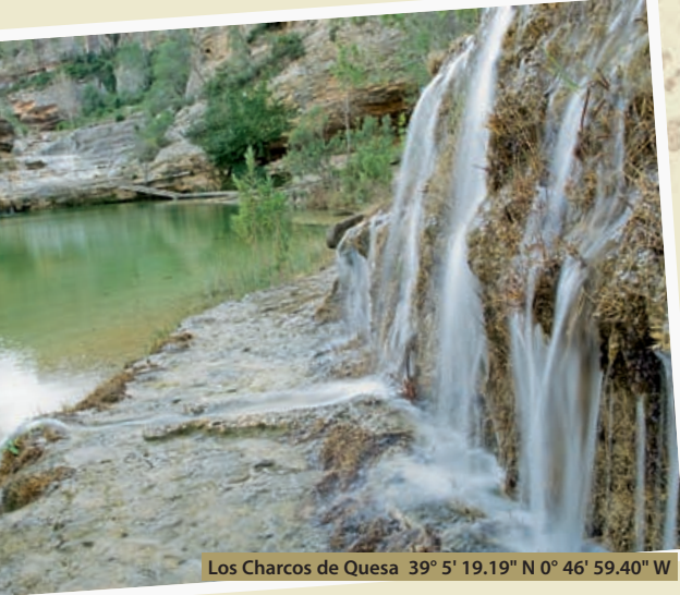
Los Charcos de Quesa 39° 5' 19.19" N 0° 46' 59.40" W