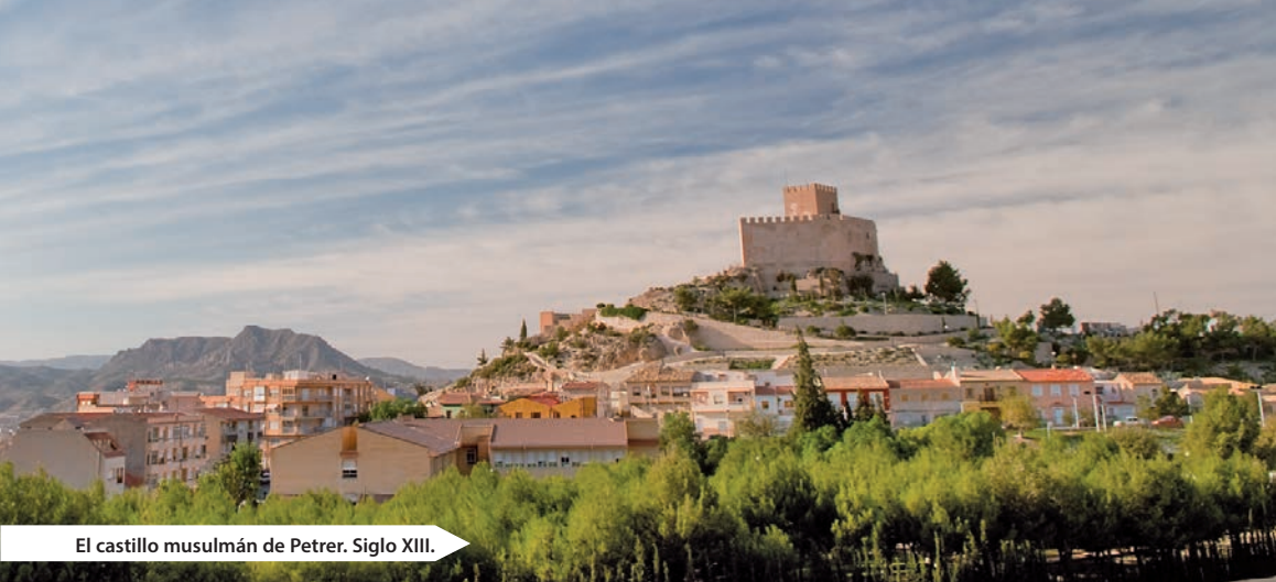
El castillo musulmán de Petrer. Siglo XIII.

inicial del PR salva el pedestal de la montaña por una estrecha carretera de servicio en un espacio totalmente antropizado, por lo cual veo aconsejable resolverlo en coche, hasta la casa/cueva forestal, un total de 3 kilómetros, lugar a partir del cual la ruta reúne los mayores valores paisajísticos y excursionistas.