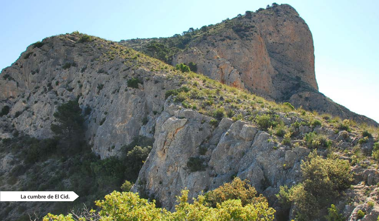
La cumbre de El Cid.

marquesado de Villena, se incorporaron a Alicante, en la nueva compartimentación provincial.