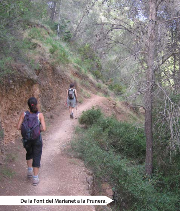
De la Font del Marianet a la Prunera.