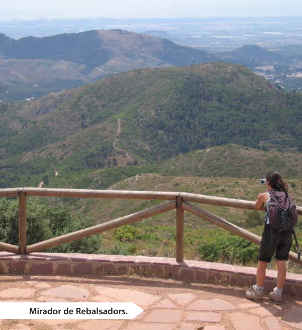
Mirador de Rebalsadors.