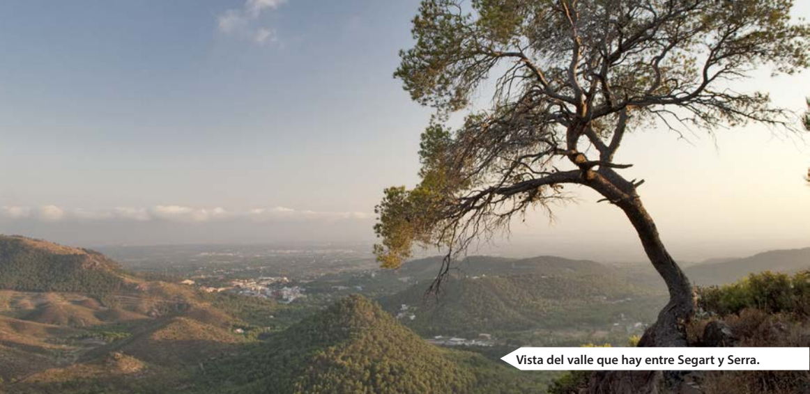
Vista del valle que hay entre Segart y Serra.