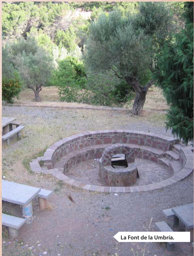
La Font de la Umbría.

La fuente está en un paraje ideal para almorzar ya que no es accesible a vehículos. Debemos seguir subiendo por la senda, paralelos a unas casetas y campos de cultivo hasta conectar de nuevo con la pista que lleva directa a la Font del Llentiscler. Desde el Llentiscler solo resta andar unos metros hasta el cruce de pistas (Collado del Llentiscler) donde se sitúa un panel, un poste de senderos y el antiguo refugio de montaña. Este punto es importante, ya que dejamos temporalmente las marcas del GR 10 para subir directos por la pista al Mirador de Rebaladors, pudiendo pasar de camino al mirador por el Ventisquero (pozo de nieve abierto que queda junto a unas antenas de telecomunicación a unos 300 metros por una pista que sale a la derecha de la principal).